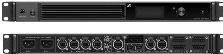
La Spectera Base Station (vue de face et de dos)

canaux RF large bande pour héberger toutes les transmissions sans fil de l'unité. Activation de la Base Station par LinkDesk : la licence Spectera définit le spectre de fréquences propre à chaque région.